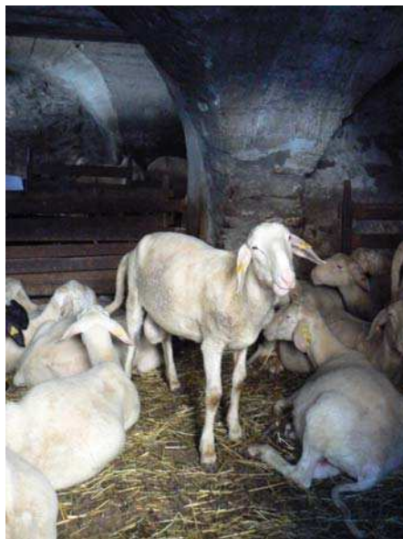
Centre de sélection des béliers de la race Sambucana dans la bergerie de l'écomusée du pastoralisme

Pour les élus locaux, ce moment est également très important ; la foire vient chaque année réactiver l'adhésion de la population au projet commun d'identification autour de la culture pastorale. Elle a une aura régionale qui permet à la vallée de se positionner comme un territoire dynamique.