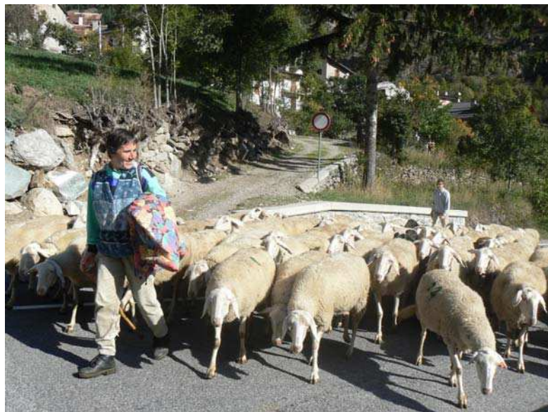
Troupeau de brebis Sambucana de la famille Giordano à Pontebernardo