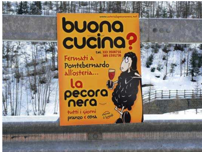
Affiche du restaurant « la Pecora Nera » à Pontebernardo, point de dégustation de la viande d'agneau