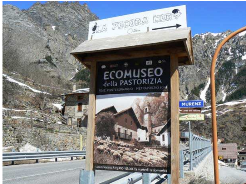
Panneau de l'écumusee du pastoralisme à l'entrée du village de Pontebernardo