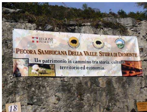
Banderole affichée lors de la foire ovine de la Toussaint à Vinadio