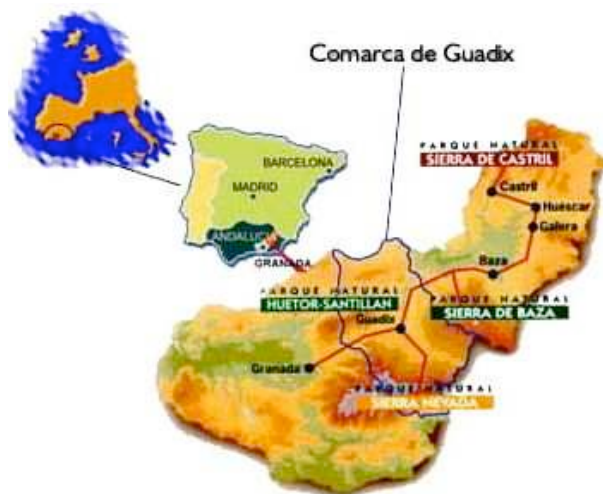
Figure 1. Comarca de Guadix-Marquesado

Le territoire concerné par le programme LEADER comprend la Hoya 29 de Guadix et le Marquesado de Zenete , corridor de hautes plaines qui relie la Fosse avec la vallée de la rivière Río Nacimiento dans la province d'Almeria.