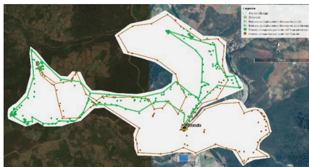
Fig. 2. Itinéraire de déplacement des chèvres sur le parcours de Dardara.