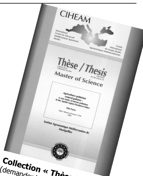
Collection « Thèse Master » (demander les catalogues aux IAM) Master Thesis Collection (request catalogues from IAMs)