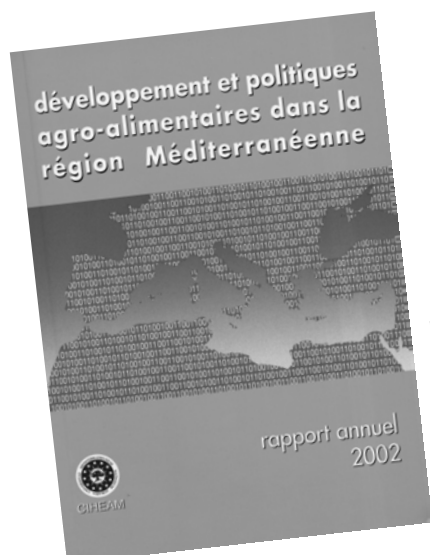
Rapport annuel : Développement et politiques agro-alimentaires dans la région méditerranéenne (s'adresser à l'IAM de Montpellier) Annual Report: Development and Agro-food policies in the Mediterranean region (contact IAM Montpellier)