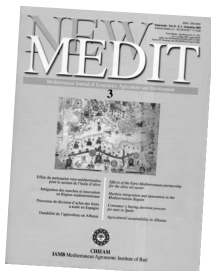
New Medit : Revue trimestrielle (s'adresser à l'IAM de Bari) Quarterly journal (contact IAM Bari)