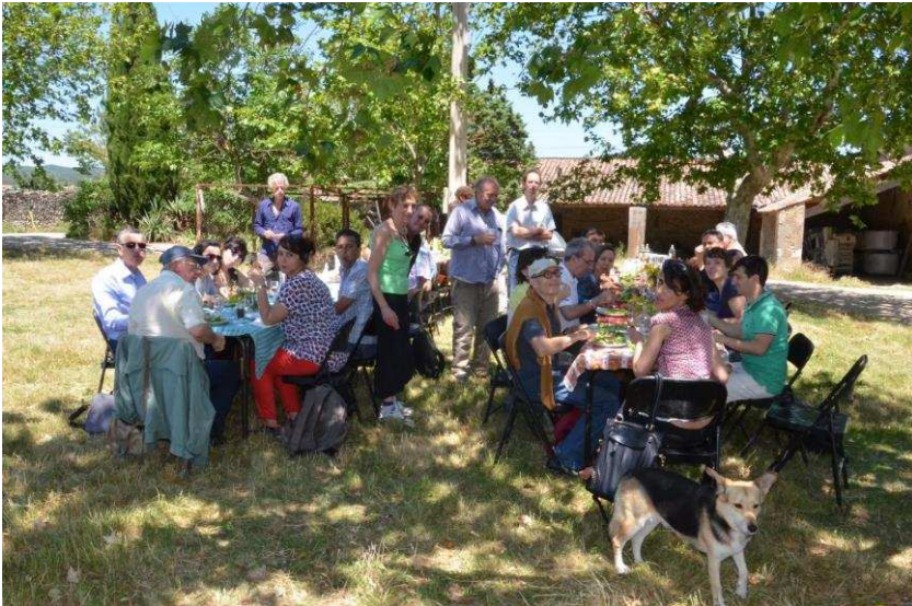
Repas réunissant les membres du réseau Foncimed et les agriculteurs de La Grange des Prés à Barjac (Gard)